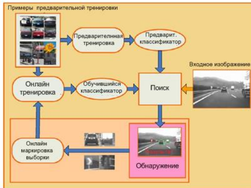
Рис. 3. Принцип работы системы Camera Vision на основе искусственного интеллекта

Другой, широко используемый алгоритм работы системы Camera Vision, который может применяться для обнаружения любых объектов, приведен на рис.3 [5].