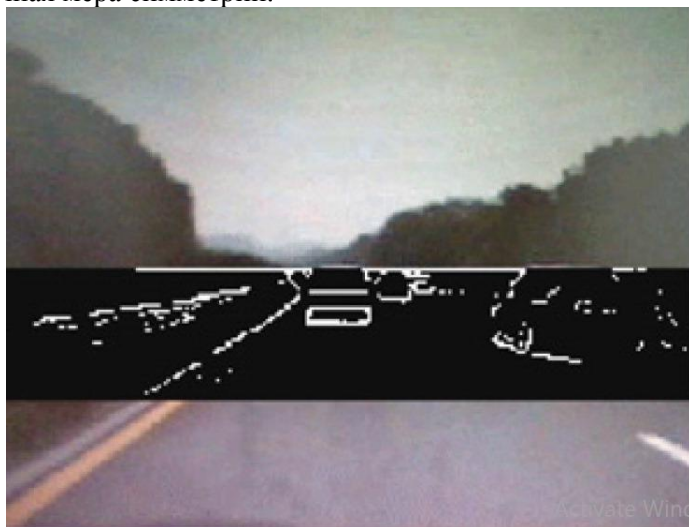
Рис. 2. Выделение интересующей части изображения