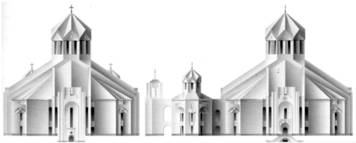
Նկ. 4. Մուրբ Գրիգոր Լուսավորչի եկեղեցու արևմտյան և հարավային ճակատները

Այս ամբողջ տարածքը, բացի դրսի անմիջական կապից, աստիճաններով կապված են նաև գավթի հետ, որը նշանակում է ներքին հարմար կապ մատուռների, գլխավոր եկեղեցու և նույն հարթության վրա գտնվող արևմտյան մուտքի հետ (նկ. 4):