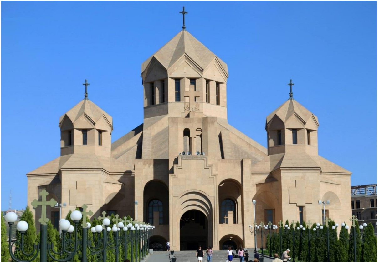
Նկ.1. Ս Գրիգոր Լուսավորիչ եկեղեցու համալիրի ընդհանուր տեսքը

Եկեղեցու համալիրը: Կազմի մեջ ընդգրկված են Սուրբ Գրիգոր Մայր եկեղեցին, Սուրբ Տրդատ թագավորի և Սուրբ Աշխեն թագուհու մատուռները, գավիթը, զանգակատունը, վանատունը, մոմավառության սրահը, ավտոմեքենաների վերգետնյա և ստորգետնյա կայանատեղերը: Մայր եկեղեցու ներքնի հարկում ընդունելությունների և եկեղեցուն առնչվող միջոցառումների համար նախատեսված են սրահներ (նկ.1):