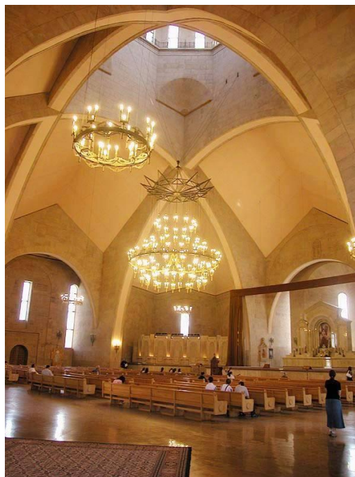
Նկ. 3. Սուրբ Գրիգոր Լուսավորիչ եկեղեցու ներքնատեսքը