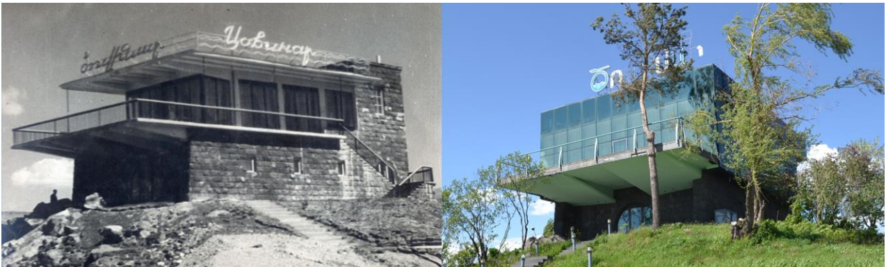
Նկ. 2. «Ծովինար» ռեստորանի նախկին և ներկա տեսքը

կորցրել է ճարտարապետագեղարվեստական կերպարը՝ շենքի օգտագործելի մակերեսը մեծացնելու նպատակով աղավաղվել է շենքի ճարտարապետությունը: