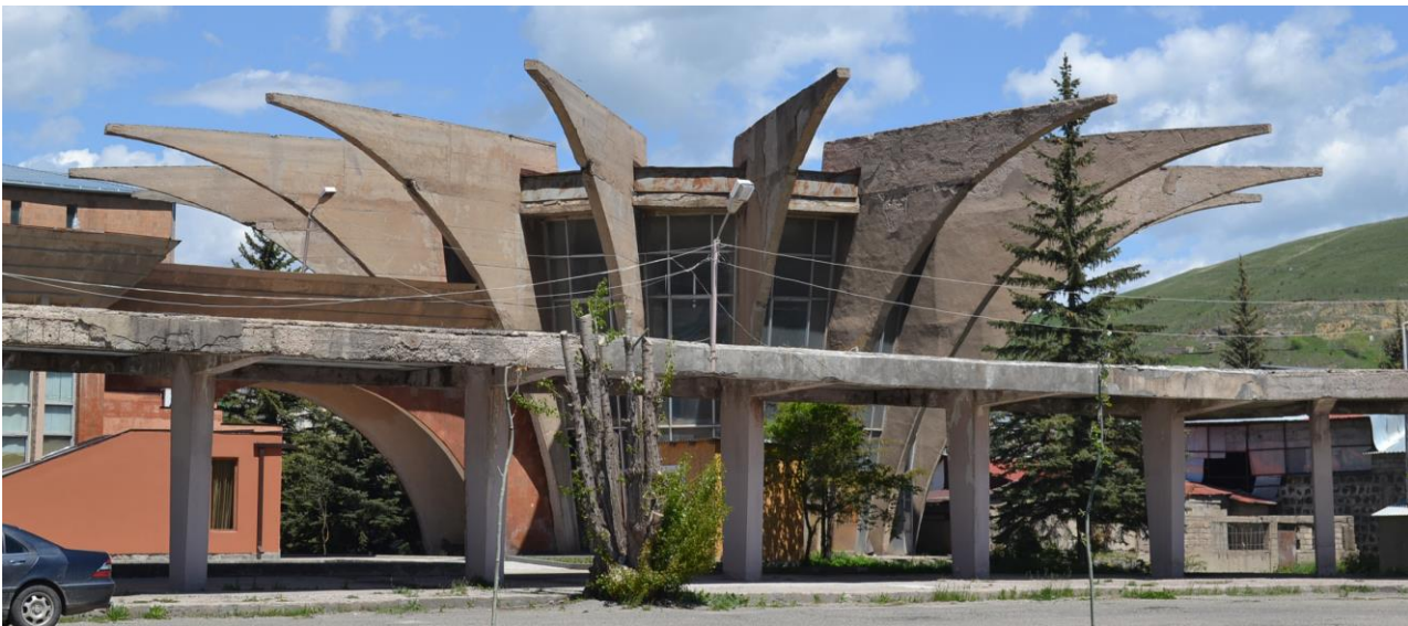
Նկ. 3. Ավտոկայարանին կից հուշանվերների խանութ

Հրազդան քաղաքի կարևորագույն հասարակական սպասարկման օբյեկտներից է երկաթուղու կայարանը: Ուսումնասիրությունները ցույց տվեցին, որ այն ունի սպասարկման լիարժեք կազմակերպմանը խոչընդոտող մի շարք խնդիրներ: Կայարանից ոչ հեռու գտնվում է քաղաքի համար կրկին կարևոր նշանակություն ունեցող ավտոկայանը: Այսօր այն ամբողջությամբ կորցրել է իր գործառնությունը: Շինությունը ծառայում է որպես հանդիսությունների սրահ: Ավտոկայանին կից տեղակայված է Խորհրդային մոդեռնիզմի ճարտարապետական մի հետաքրքիր շինություն (նկ.3), որը նախկինում եղել է հուշանվերների խանութ: Այսօր այդ շինությունն մատնված է անուշադրության և ունի խնամքի կարիք: