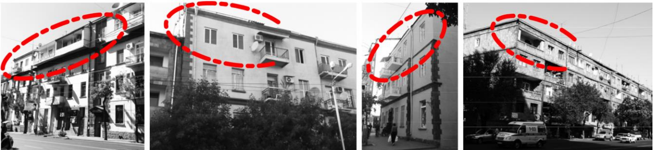
Նկ. 1. Երևանի բնակելի շենքերի վերակառուցման գործընթացը խորհրդային տարիներին

Խորհրդային տարիներին այս շրջանի բնակելի կառուցապատման փոփոխությունները հիմնականում իրականացվել են 1920-ականների շենքերի վերակառուցման նպատակով: Այդ առաջին բազմաբնակարան շենքերի վերակառուցման համար արդեն 1930-ականների վերջին առաջացան երկու հիմնական պատճառներ՝ բնակելի ֆոնդի լրացում և քաղաքային փողոցների կառուցապատման նոր մասշտաբի ապահովում: Այս խնդիրների համատեղ լուծման պահանջն էլ պայմանավորեց վերակառուցման բնույթը՝ վերնահարկերի իրականացում: Լրացուցիչ հարկը թույլ էր տալիս փոքր միջոցներով ավելացնել բնակելի ֆոնդը և շենքերի ծավալները բերել 1930-ականներին վերջնականապես ամրապնդված փողոցների քաղաքային մասշտաբին [1] (նկ.1): Պլանավորված վերակառուցման այլ դրսևորումներ էին խորհրդային տարիներին բնակելի շենքերին բակային ճակատների կողմից խորը խորշապատշգամբներ կցելու և միջհարկային ծածկերի վերակառուցման գործընթացները: Պետք է նշել, որ դրանց արդյունքում շենքերի տարբեր ձևափոխություններն ընդհանուր առմամբ ներդաշնակվել են նախկին կառուցվածքին և քաղաքացիների մեծ մասն այսօր չի նկատում այդ փոփոխությունները: