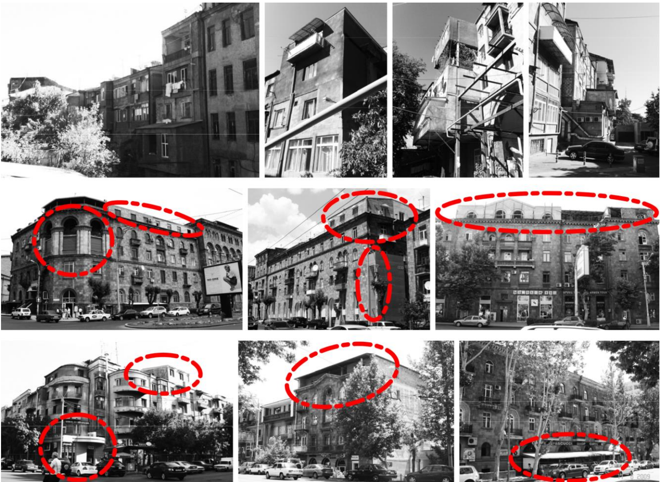
Նկ. 2. Երևանի բնակելի շենքերի վերակառուցման գործընթացը վերջին տասնամյակներում. կցակառույցներ, տանիքների և ճակատային հարթության աղավաղումներ

Ինչպես արդեն նշվեց, ժամանակն իր ազդեցությունն է թողնում յուրաքանչյուր կառուցվածքի վրա, և բնակելի շենքի կենսագործունեության ընթացքը չի կարող զերծ մնալ փոփոխությունների մշտական գործընթացից [8]: Արդի քաղաքաշինության կարևոր