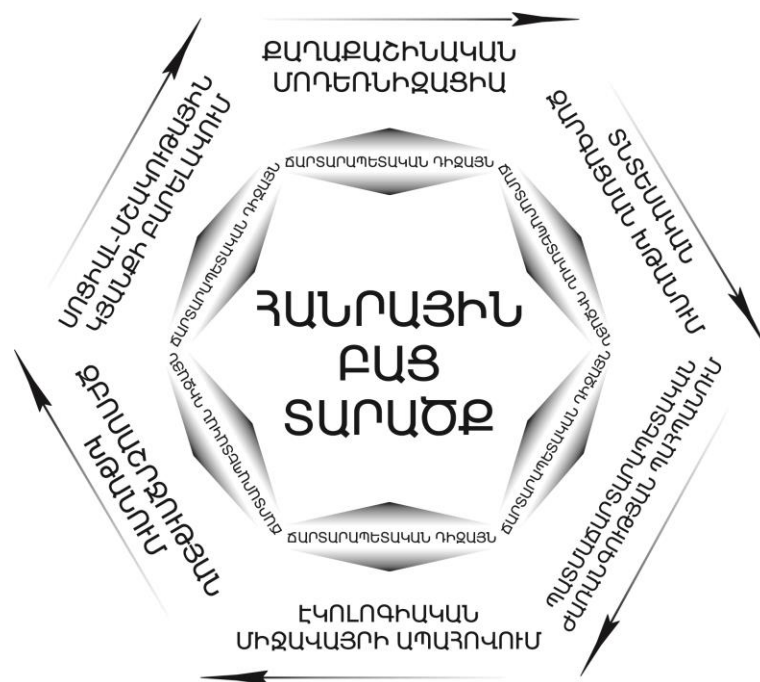
Նկ. 4. Հանրային բաց տարածքի ճարտարապետական դիզայնի գործառույթների փոխկապակցվածությունն արտահայտող սխեման

Հանրային բաց տարածքները կարող են լինել զբոսաշրջության զարգացմանը նպաստող օղակներ, ինչպես նաև լուծել քաղաքային բնակչության սոցիալ-մշակութային խնդիրները, դառնալ միջավայրի պահպանման օղակներ և քաղաքը դարձնել ապրելու համար առավել բարենպաստ վայր: Ուսումնասիրված հանրային բաց տարածքների ճարտարապետական դիզայնի գործառույթներն, անկախ վերը նշվածների ժամանակագրական ծագումից, մեկը մյուսից բխող և փոխկապակցված են (նկ.4):