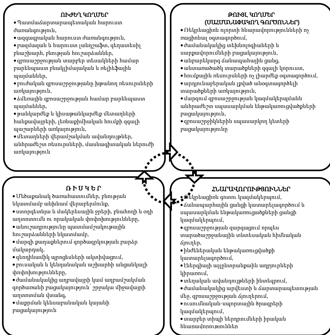
Նկ. 2. Լոռու մարզի պոտենցիալի գնահատման սխեմա (SWOT վերլուծություն. ուժեղ, թույլ կողմեր, հնարավորություններ և ռիսկեր)

Ընդհանրացնելով վերոնշյալ հետազոտության արդյունքերը, ստորև ներկայացվում է մարզի ուժեղ, թույլ կողմերի, հնարավորությունների և ռիսկերի (SWOT) վերլուծությունը (նկ. 2)։