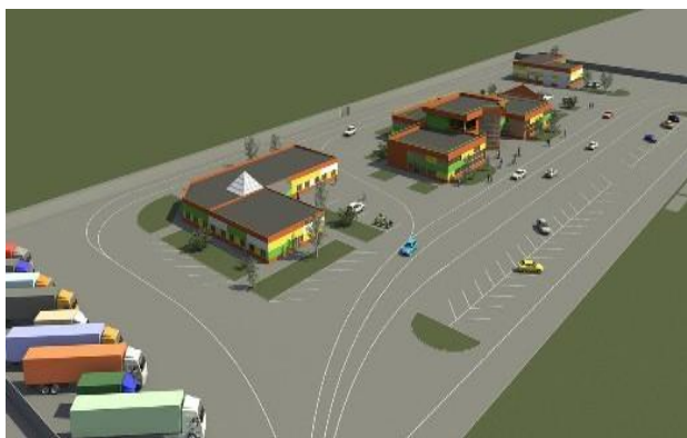
Ճանապարհային ծառայության կետ