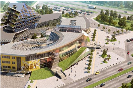
Բազմաֆունկցիոնալ առևտրի կենտրոն