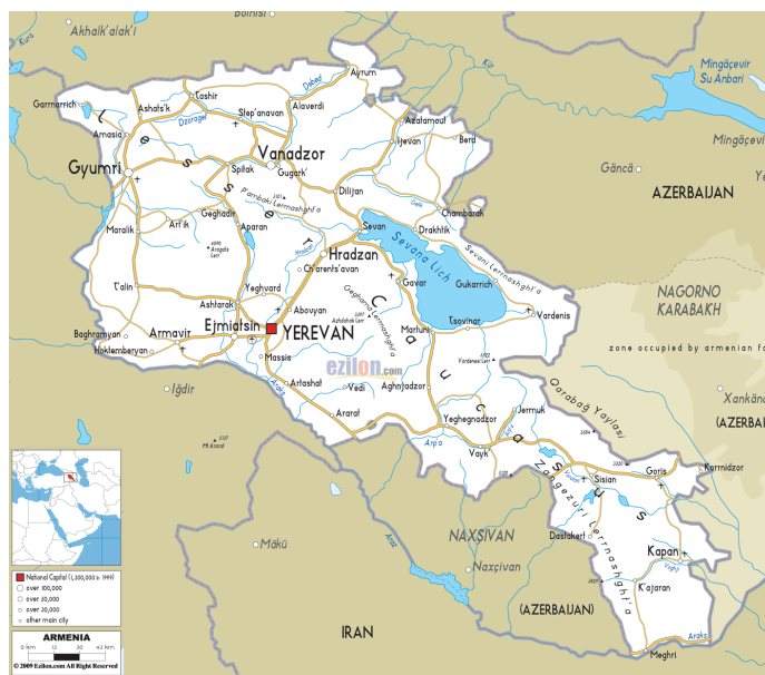
Նկ. 7. Հայաստանի ավտոմոբիլային ճանապարհների քարտեզ