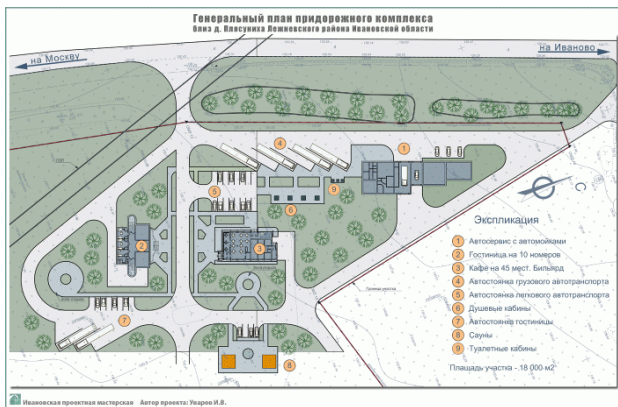
Ճանապարհային ծառայության կետ

գ) ճանապարհային ինժեներական շինություններ՝ ճանապարհի մասեր, որոնք ապահովում են ճանապարհների շահագործման և դրանցից օգտվելու պահանջները: Դրանք են՝ կանգառները, ավտոտաղավարները, արագացման և արգելակման գոտիները, տրանսպորտային միջոցների կայանատեղերը, հանգստյան (ժամանակավոր) գոտիները, տեսահարթակները, ձյունապաշտպան անտառաշերտերը, տնկիները, օտարման շերտից դուրս գտնվող շրջանցող ուղիները, հակահեղեղային և հակաձնահոսային կառույցները, հակավթարային գրպանները, ճանապարհային կապի և լուսավորության շինությունները և այլն (նկ. 1):