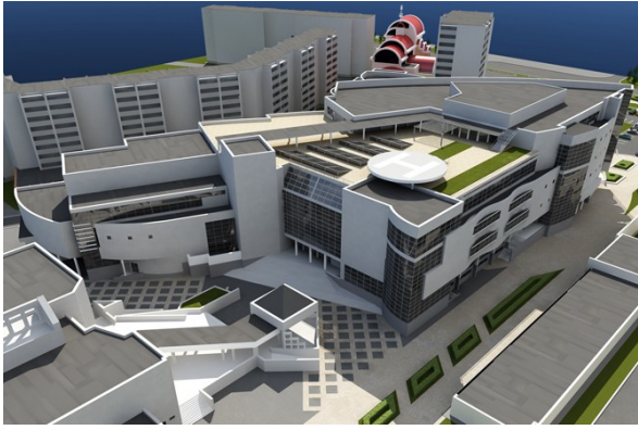
Բազմաֆունկցիոնալ միջազգային առևտրի կենտրոն