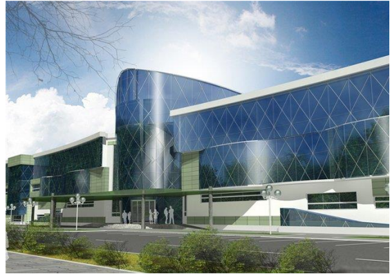
Բազմաֆունկցիոնալ գործարար կենտրոն