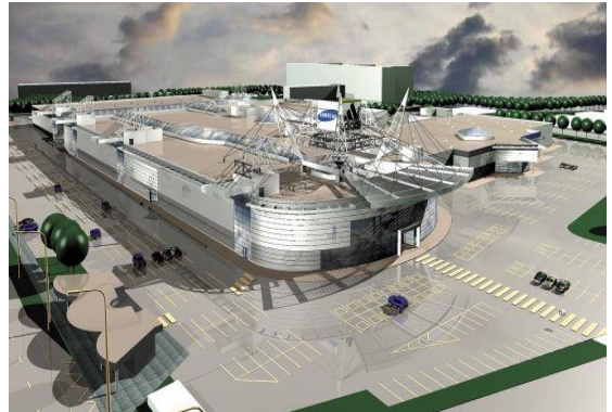
Բազմաֆունկցիոնալ գործարար կենտրոն