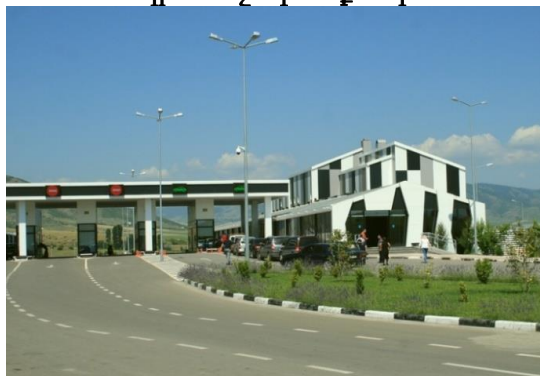
Բազրատաշենի սահմանապահ կետ