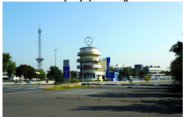
Տրանսպորտային սպասարկման կետ