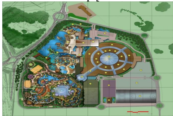
Հանգստի և ժամանցի համալիրի գլխավոր հատակագիծ