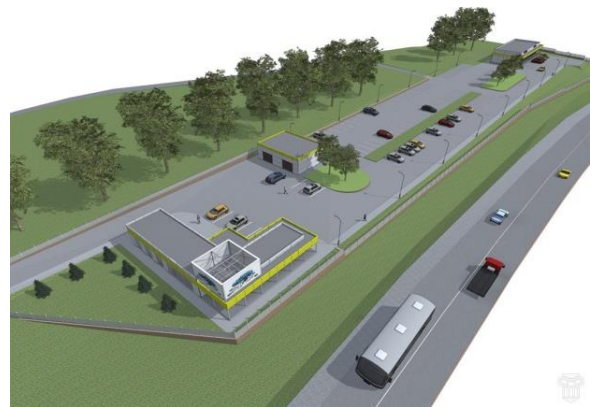
Ճանապարհային ծառայության կետ