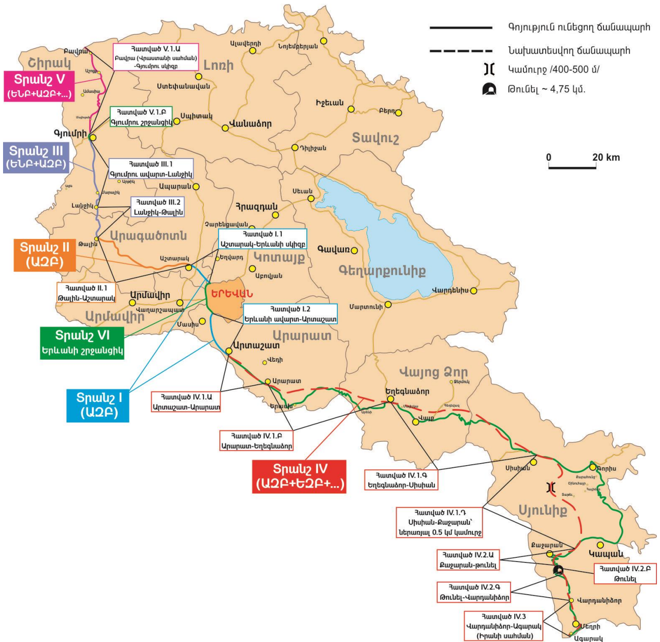
Նկ. 8. «Հյուսիս-հարավ» ճանապարհային միջանցք

Միաժամանակ առաջիկա ժամանակահատվածում էական և լուրջ ուշադրության է արժանի Ասիական Զարգացման Բանկի աջակցությամբ ներդրումային ծրագրով կառուցվող «Հյուսիս-Հարավ» ճանապարհային միջանցքի համապատասխան կահավորումը, որի էական հատվածը համապատասխանում է վերը նշված ուղղություններին (նկ. 8): Յուրաքանչյուր օբյեկտի տեղակայման տեղի ընտրությունն ըստ գործառնական նշանակության պետք է կատարվի մանրամասն վերլուծության և համապատասխան հիմնավորման հիման վրա: