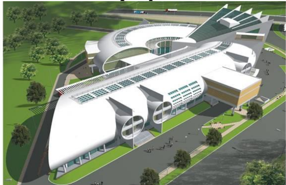
Բազմաֆունկցիոնալ մեծածախ առևտրի կենտրոն