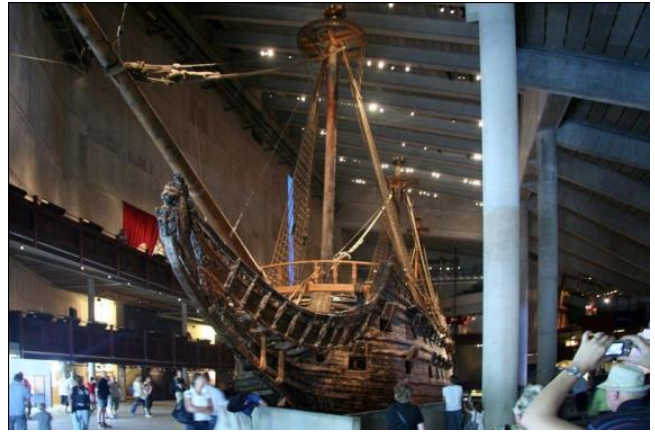
Նկ. 3. «Վասա» թանգարանը, Մտոկհոլմ՝ հիմնադրված 1990 թ .

Սակայն երբեմն թանգարան կազմավորելու համար բավարար է հատկացնել մի քանի սենյակներ: Սա սովորաբար հարմար է դպրոցներին, համալսարաններին կից ստեղծվող ուսումնական թանգարանների համար, բայց այս դեպքերում էլ է անհրաժեշտ հաշվի առնել թանգարանային շինությունների համար նախատեսված նորմատիվները: