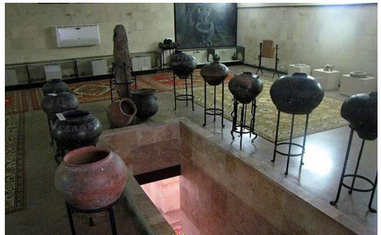
Նկ. 6. Մեծամոր թանգարանի ցուցասրահ

Զվարթնոց արգելոց-թանգարան: Զվարթնոց արգելավայրը ստեղծվել է Էջմիածնի միաբան Խաչիկ վարդապետ Դադյանի նախաձեռնությամբ 1900-1907թթ., հաշվի առնելով 1904թ. Ճարտարապետ Թորոս Թորամանյանի ղեկավարությամբ պեղումներով բացված Ս. Գրիգոր Լուսավորիչ տաճարի (կառուցված 641-652թթ.) և հարակից շինությունների ավերակների պատմաճարտարապետական բացառիկ նշանակությունն ու պատմահնագիտական գտածոների արժեքը: Իրավամբ տաճարը խոսուն վկա է ժամանակի վարպետների ճարտարապետական և շինարարական մտքի թռիչքի [4]: