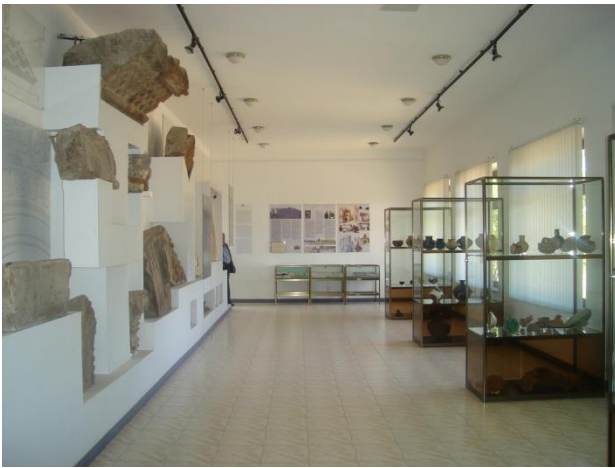
Նկ. 8. Ջվարթնոց թանգարանի առաջին ցուցասրահը