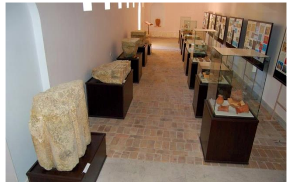
Նկ. 12. Տիգրանակերտի տարածքում գտնվող 18-րդ դարի ամրոցը: Թանգարանի ցուցասրահը

Տիգրանակերտի թանգարանը կազմված է նախասրահից և երկու ցուցասրահներից: Նախասրահում պայմաններ են ստեղծված Տիգրանակերտին վերաբերող ֆիլմերի ցուցադրություն համար, կատարվում է նաև հուշանվերների վաճառք, իսկ որմնախորշերում կազմակերպված է խեցանոթների ցուցադրություն: Առաջին սրահն ունի ներածական բնույթ: Այստեղ ներկայացված են Տիգրանակերտ քաղաքի հայտնագործման պատմությունը, ինչպես նաև կան տեղեկություններ պեղումների ընթացքի վերաբերյալ: Պատերի խորշերում ցուցադրվում են անտիկ և միջնադարյան ամբողջական անոթներ, ապակեծածկ սեղանի վրա՝ հնագիտական նյութեր, պեղումներին վերաբերող հրատարակություններ: