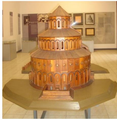
Նկ. 9. Ջվարթնոցի մանրակերտը (երկրորդ սրահ)

Բացօթյա ցուցադրությունում ցուցադրվում են Ջվարթնոց տաճարի ավերակների ամրակայած և մասնակի վերականգնած պատերի մնացորդներ, սյուների խարխախներ, բներ, զամբյուղախոյակ և արծվախոյակ սյունաշարեր, կամարներ, բարավորների քիվեր, թաղակապ ծածկերի կրաշաղախե խոշոր զանգվածներ, մկրտության ավազան, ջրհոր, տաճարից պահպանված զարդաքանդակներ, տաճարի հարավարևմտյան մասում գտնվող կաթողիկոսական պալատը, վանականների խցերը, բաղնիքը, 4...5-րդ դարի բազիլիկ եկեղեցու մնացորդները և գինու հնձանը, պեղումների ընթացքում համալիրի տարածքից հայտնաբերված մ.թ.ա. 2...1-ին հազարամյակներով թվագրվող կլոր սալաքարը (չորս տարբեր փոսիկներով և առվակով), նախաքրիստոնեական շրջանի պաշտամունքային ֆալլոսիպ կոթողը, ինչպես նաև ուրարտական Ռուսա II արքայի (Ք. ա. 685-645թթ.) սեպագիր արձանագրությունը: