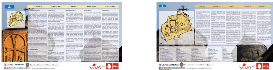
Նկ. 1. Տեղեկատվական վահանակներ Հաղպատում

որի նպատակն էր տեղեկատու վահանակների միջոցով զբոսաշրջիկներին ծանոթացնել Հայաստանի պատմամշակութային կոթողներին: Արդյունքում տեղադրվեցին 5 լեզվով 382 տեղեկատու վահանակներ Սանահինում, Գոշավանքում, Աղթալայում և 150-ից ավելի հնավայրերում, որոնք օգնում էին այցելուին հուշարձանի պատմությանը ծանոթանալ ինքնուրույն, առանց զբոսավարի: 2013 թ. ապրիլին Հայաստանի Հանրապետության Մշակույթի նախարարության և «Հայկական հուշարձանների ճանաչման ծրագիր» մշակութային հասարակական կազմակերպության (ԱՄՄՓ) միջև ստորագրվել է «Հայաստանի Հանրապետության տարածքում գտնվող պատմամշակութային հուշարձանների վերաբերյալ բազմալեզու տեղեկատվական վահանակներ տեղադրելու մասին» համաձայնագիր: Դրանք պատմամշակութային տեղեկատվություն են ներկայացնում 5 լեզվով՝ հայերեն, անգլերեն, ռուսերեն, իտալերեն ու ֆրանսերեն (նկ. 1): Ծրագրի նախաձեռնողը Ռիչարդ Նայն է: Գյումրիում Իտալիայի պատվո հյուպատոս Անտոնիո Մոնտալտոնի հովանավորությանը և ՀՀ մշակույթի նախարարության օժանդակությանը զուգահեռ՝ «ՎիվաՄելը» դարձավ ծրագրի համագործակցող հովանավորը: Ծրագրին օժանդակում է նաև ԻԿՕՍՕՍ/Հայաստան հասարակական կազմակերպությունը [1]: