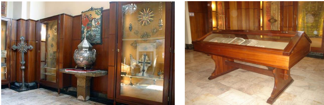
Նկ. 10. Էջմիածնի Մայր Տաճարի թանգարանի ցուցասրահները

Էջմիածնի Մայր Տաճարի թանգարանում պահվող արժեքավոր գանձերի ցուցադրությունը կազմակերպվում է երկու ցուցասրահներում, որոնց կենտրոններում տեղադրված ապակեպատ սեղաններում ներկայացվում են արծաթակազմ մագաղաթյա մատյանները, իսկ պատերի ողջ պարագծով տեղակայված փայտյա պահարաններում՝ սրբազան գանձերը (նկ. 10): Ցուցադրվող սրբազան գանձերից են Ս. Գեղարդը, Ս. Գրիգոր Լուսավորչի Աջը, Նոյյան Տապանի մասունքը, Խոտակերաց Սուրբ Նշան մասանց պահարանը՝ Հիսուս Քրիստոսի Ս. Խաչափայտի մասունքներով, ձեռագիր մատյաններ և այլ արժեքավոր նմուշներ: