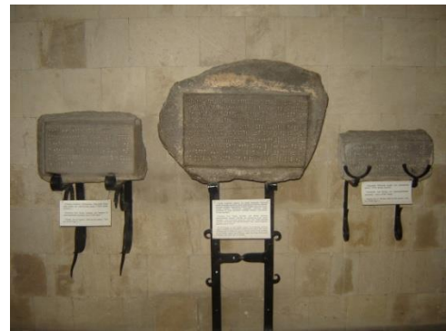
Նկ. 3. Քարե սեպագիր արձանագրություններ

Թանգարանային հավաքածուի բացառիկ արժեքները բազմիցս ցուցադրվել են Լուվրում (Ֆրանսիա), Մետրոպոլիտեն թանգարանում (ԱՄՆ), Էրմիտաժում (Ռուսաստան), Բրիտանական թանգարանում (Մեծ Բրիտանիա) և հանրահայտ այլ մշակութային օջախներում [3]: Թանգարանի շենքի ձախ կողմի աստիճանները տանում են դեպի բարձր բլուրը, որի վրա են գտնվում Էրեբունի ամրոցի ամրակայված և մասնակի վերականգնված հուշարձանները: Այցելուների համար նախատեսված են բարեկարգ ճանապարհներ և բազմալեզու տեղեկատվական վահանակներ: Տարածքում շարունակվում են պեղման աշխատանքները (նկ.4):