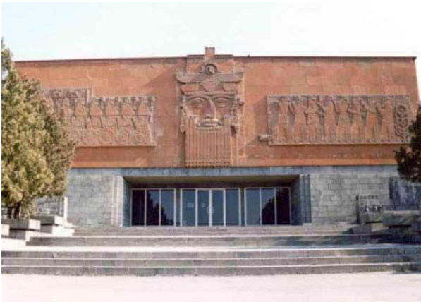
Նկ. 2. Էրեբունի թանգարանի շենքը

են ամրոցի տարածքից հայտնաբերված քարե արձանագրություններ (նկ. 3), հնագիտական իրեր, գինու հսկայական կարասներ, զենքեր, աշխատանքային գործիքներ, հացահատիկային կուլտուրաներ: