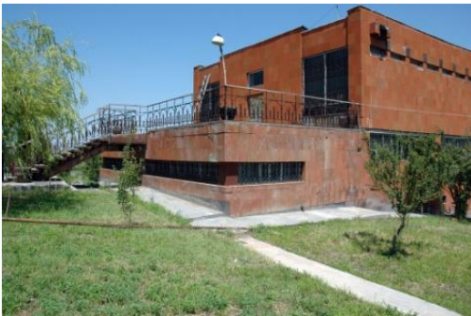
Նկ. 5. Մեծամոր թանգարանի շենքը

«Մեծամոր» պատմահնագիտական արգելոց-թանգարանը բացվել է 1968թ. (նկ. 5): Ներկայումս այն գործում է «Պատմամշակութային արգելոց-թանգարանների և պատմական միջավայրի պահպանության ծառայություն» ՊՈԱԿ-ի կազմում: Այստեղ հավաքվել և ցուցադրվել են հուշարձանից պեղված 27000-ից ավել առարկաներ: Առաջին հարկում ցուցադրվում են ամրոցում և դամբարանադաշտում հայտնաբերված նյութերը, որոնք վերաբերում են վաղ բրոնզե դարից մինչև ուշ միջնադարին: Երկրորդ հարկում ներկայացված են Մեծամորի հնագույն արհեստներն ու ձեսերը (նկ. 6): Նկուղային հարկում գտնվում է հատուկ զետեղարանը, ուր ներկայացված են Վանի թագավորության շրջանի ոսկե, արծաթե, սաթե, կիսաթանկարժեք քարերից, մածուկից պատրաստված եզակի մշակութային արժեքներ: