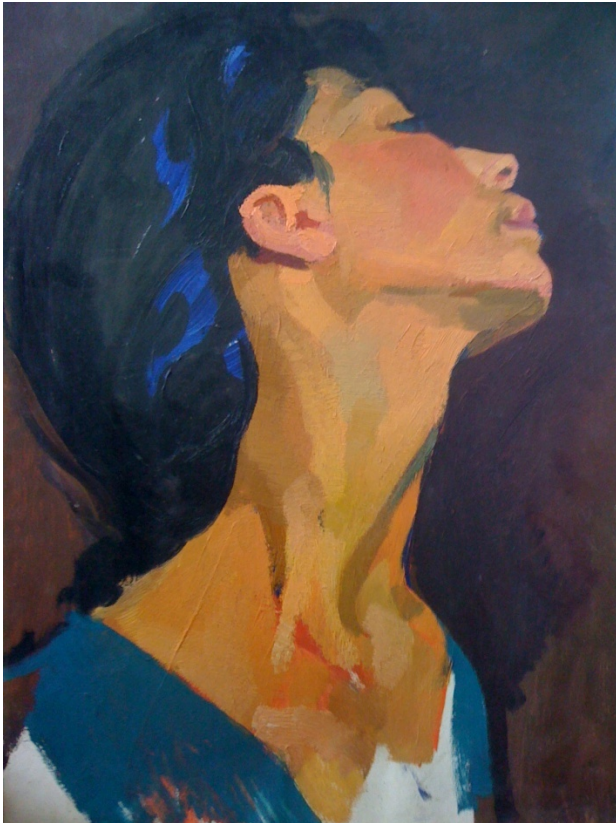
Նկ. 6. Նախանկար-դիմապատկեր «Պոռթկում» հորինվածքի առաջին տարբերակի համար

Մարտիրոս Մարյանի ստեղծագործական մայրամուտին վրձնած «Երկիր» (1969 թ.) և «Հեքիաթ» (1971 թ.) աշխատանքների հետ):