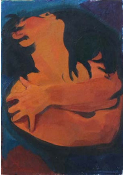
Նկ. 8. Նախապատրաստական նյութ «Պտոթկում» հորինվածքի երրորդ տարբերակի համար