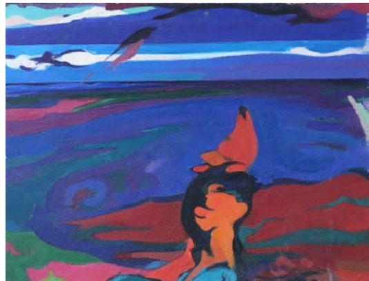
Նկ. 5. Նախանկար «Պոռթկում» հորինվածքի առաջին տարբերակի համար

«Ձգտում» հորինվածքի, կարելի է ասել, գաղափարական շարունակությունն է «Պոռթկում» նկարաշարը (1962–1964 թթ.), ուր պարզապես ձգտումը վերածվում է պոռթկման անգուսպ տենչի: Առաջին նախանկարներում դեռ պահպանվում է աղջկա և եղնիկի միասնական պատկերը (անթվակիր, նկ. 5)՝ կրկին տեղային, ընդարձակ քավածքներով: Նկարիչը նրանց հետաքրքրությամբ լի հայացքներն ուղղել է վեր՝ դեպի երկինք, դեպի տիեզերք, իսկ յուղանկարի ֆոնն ամբողջությամբ վերածել խոշոր գունային գոտիների, որոնց հնչեղ գունաբծերն ի հայտ են գալիս մերթ շրջագծերի, մերթ ալիքվող ռիթմերի ձևով (այս առումով «Պոռթկմանը» և դրան նախորդած «Ձգտմանը» վերաբերող շատ աշխատանքներ կարելի է համադրել