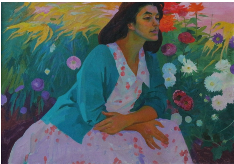
Նկ. 2. Նախապատրաստական նյութ «Ձգտում» հորինվածքի համար

Հերոսուհու կերպարն ստանալու համար Չարդարյանին բնորոշ դուստրը: Նկարչի խառնվածքի համաձայն` արվեցին բազում էսքիզներ, որոնք դիտարկելիս հստակ երևում է այն ուղին, որով ընթացավ հեղինակի ստեղծագործական միտքը: Հորիզոնական ձևաչափի մեջ արված դիմանկար էտյուդին (1959 թ., նկ. 2) հաջորդել է նույն ձևաչափի մեջ արված ևս մի կտավ (անթվակիր), որտեղ դուստր կերպարին ավելացել է եղնիկի ամբողջական ֆիգուրը: Աղջկա դեմքի թախծալի, մելամաղձոտ արտահայտությանը, որ տեսնում ենք պորտրետում, այստեղ փոխարինել է եղնիկին գուրգուրող նրա սիրազեղ կեցվածքը: Ապա արվել են ևս երկու անթվակիր աշխատանքներ` արդեն ուղղահայաց ձևաչափի մեջ (անթվակիր, նկ. 3), որոնցում գրեթե վերջնականապես գտնվել է կերպարների դիրքը և դեպի հեռուն գնացող կոմպոզիցիոն պլանների հերթագայությունը: