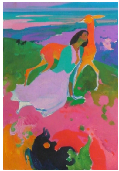
Նկ. 3. Նախապատրաստական նյութ «Ձգտում» հորինվածքի համար

Ավարտուն տարբերակում (նկ. 1) պերսոնաժներն երևում են ամբողջությամբ պրոֆիլից, ուժգնացել է նաև մոնումենտալ-դեկորատիվ հնչեղությունը, խորացել փոխաբերական արտահայտչականությունը: Մինթեզվել են, ներկայանալով մեկ ամբողջության մեջ, զուսպ վեհությունն ու նրբին լիրիզմը: Կյանքում գեղեցիկն ընդհանրական, խորհրդանշական կերպով բացահայտելու նկարչի ձգտումն արվեստաբան Ն.Ստեփանյանի կարծիքով, առավել ցայտուն արտահայտվել է այս աշխատանքում [4]: Նկարիչը հրաժարվում է ծավալային պլաստիկայից, ֆակտուրային բնութագրությունից, դիմում համահարթված ձևերի`