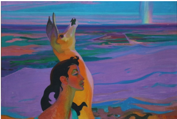
Նկ. 4. Ձգտում, 1960 թ.