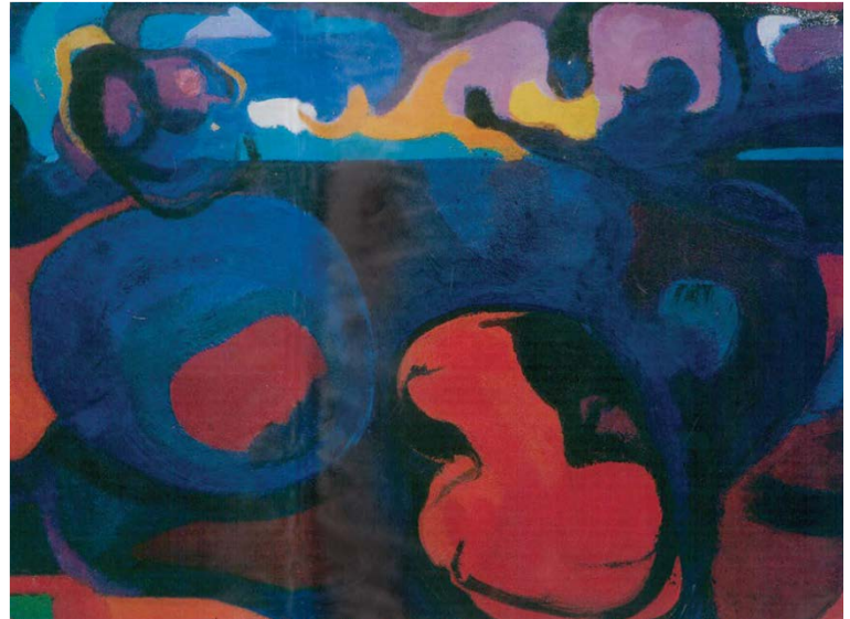
Նկ. 9. Պտոթկում (երրորդ տարբերակ), 1964թ.

Գրեթե վերացական բնույթ ստացած վերջին, ամենավարտուն տարբերակում (1964 թ., նկ. 9) սևի, կապույտի խուլ գուներանգների վրա երևան է գալիս հերոսուհու հարթային, ալ կարմիր ուրվապատկերը, որն ասես զալարվող ցավի ու կծկումի արտահայտություն լինի: Այստեղ խտացված է պրկման ողջ ուժը: Գրեթե չի ընդգծվում կանացի, մինչև իսկ՝ մարդկային սկիզբը: Այսպիսով, «Պտոթկում» նկարաշարի վրա աշխատելիս նկարիչը ընդհուպ մոտեցել է վերացականությանը: