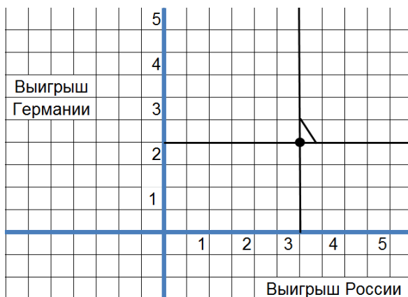
Множество равновесий Нэша